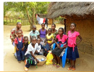
Krankenpfleger mit Familie und Nachbarn