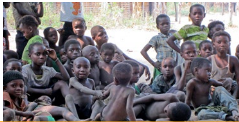
Wo man hinsieht: Kinder, der Reichtum des Kongo