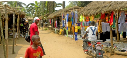
Die Einkaufsmeile des Städtchen Vanga