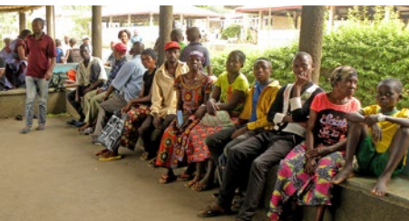
Eines der „Wartezimmer“ in Vanga