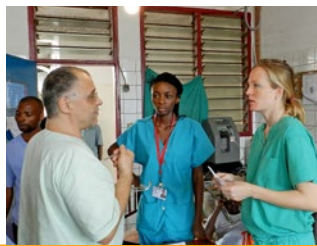
Drei Ärzte im Fachgespräch